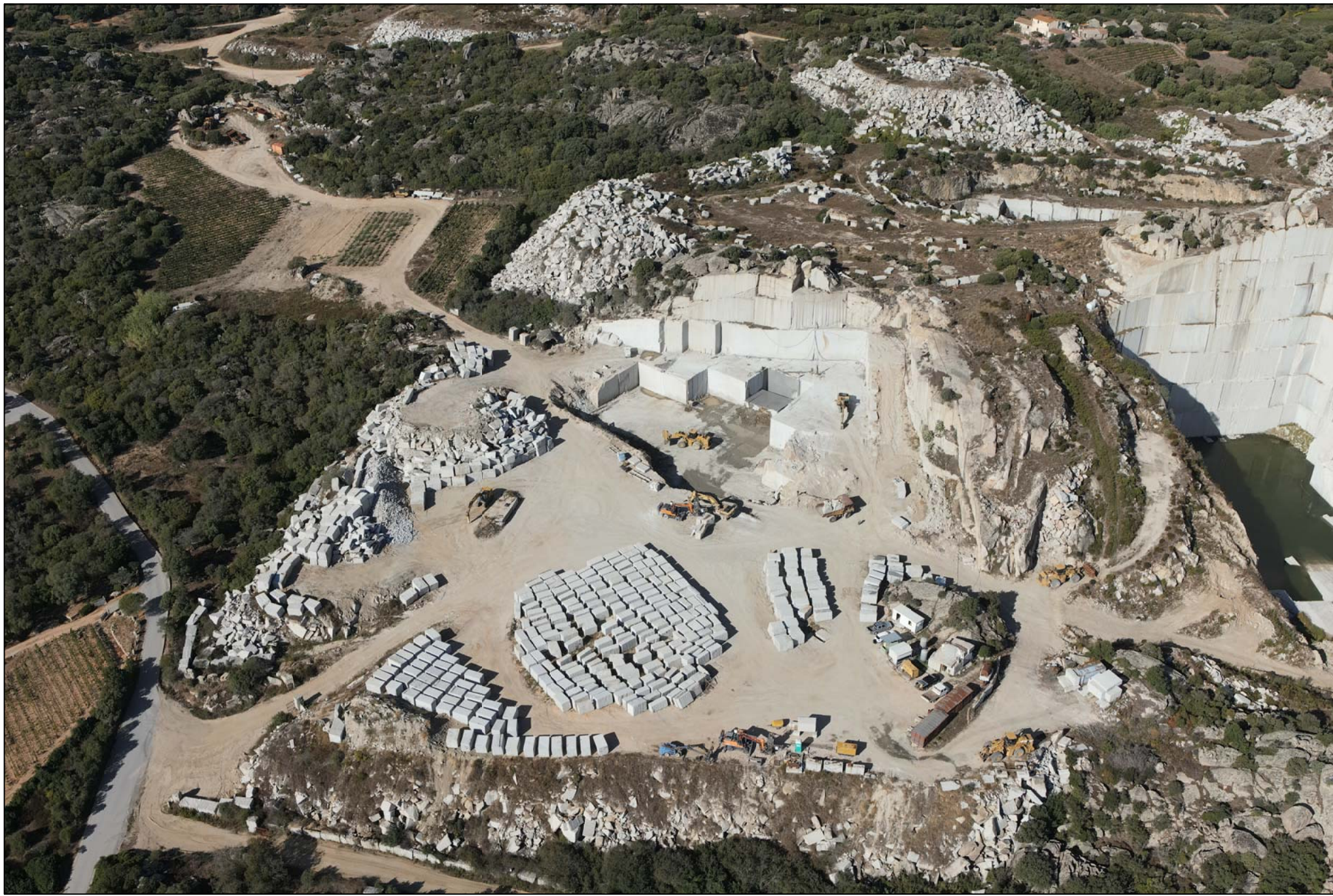
PUNTO DI VISTA 2