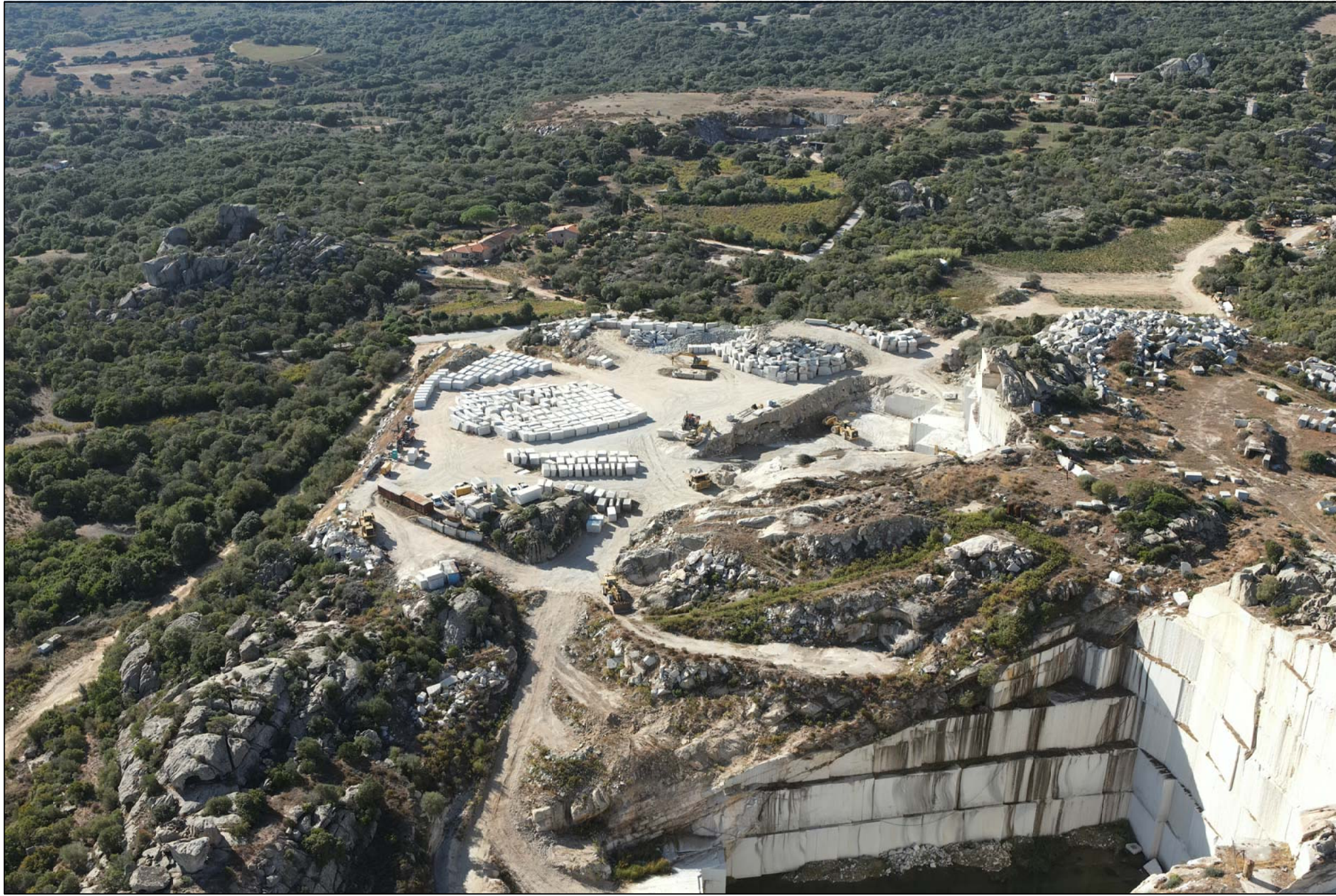
PUNTO DI VISTA 8