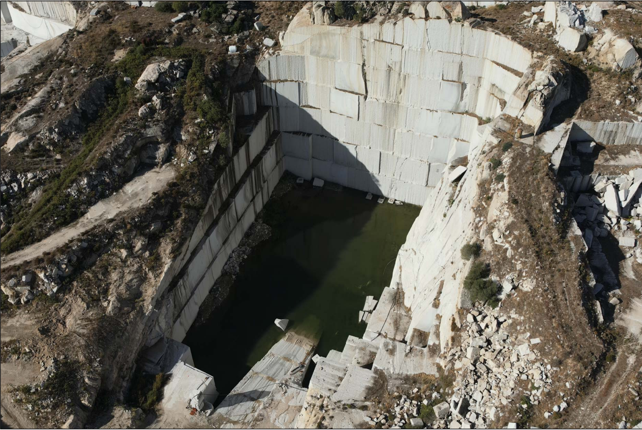
PUNTO DI VISTA 7