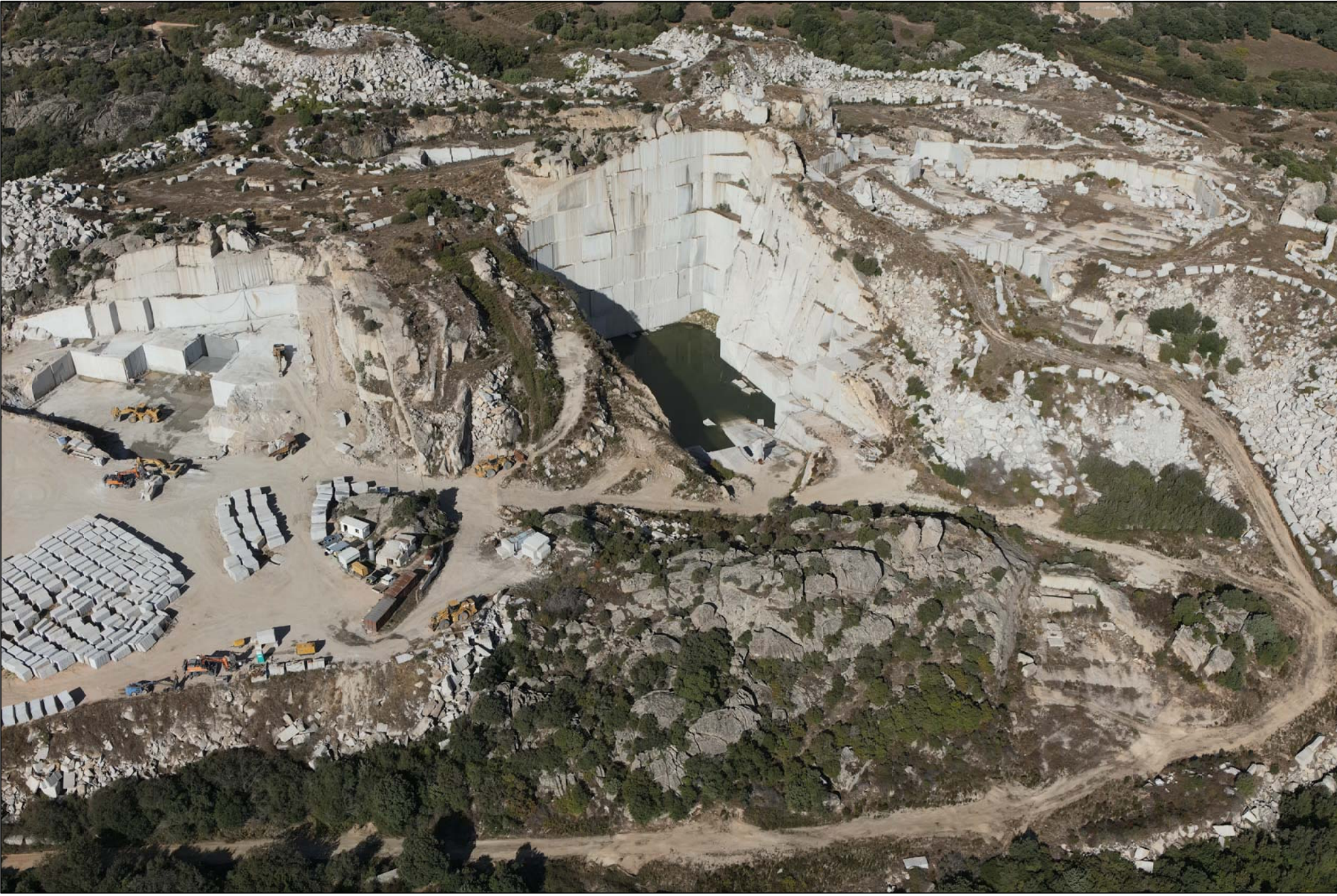
PUNTO DI VISTA 4