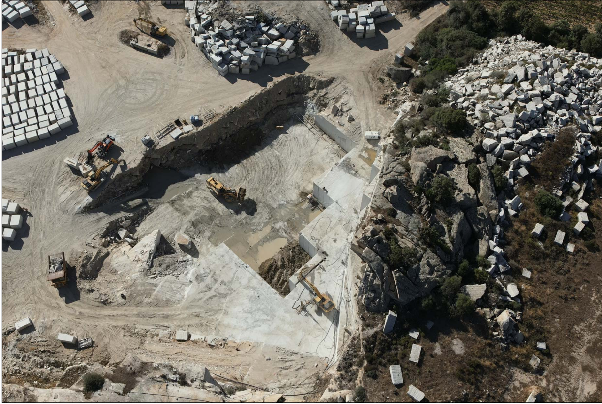
PUNTO DI VISTA 5