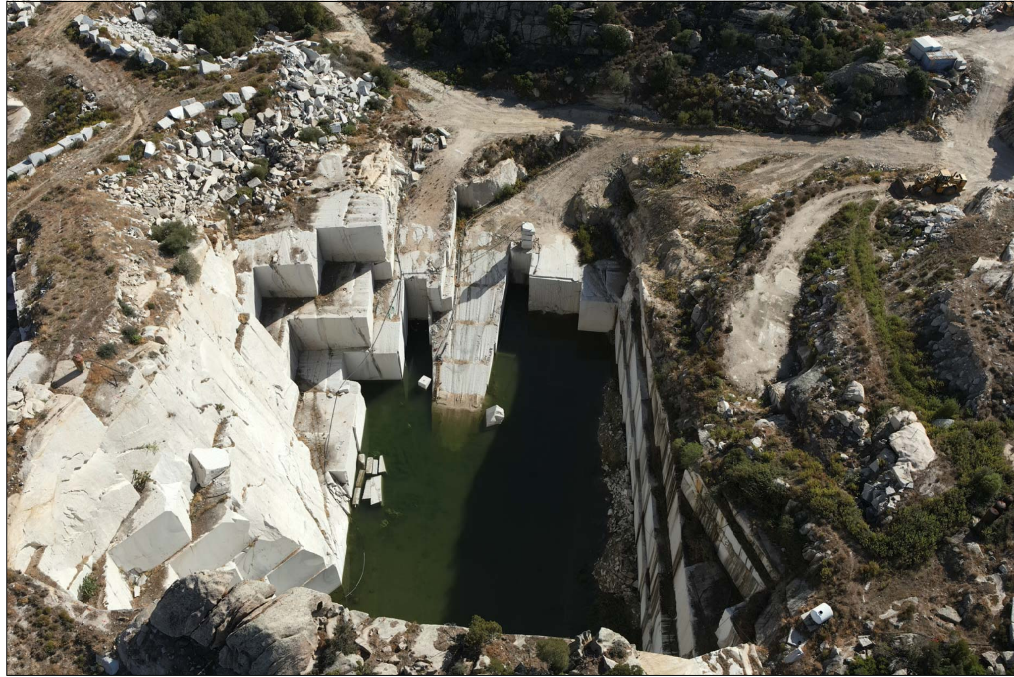
PUNTO DI VISTA 9