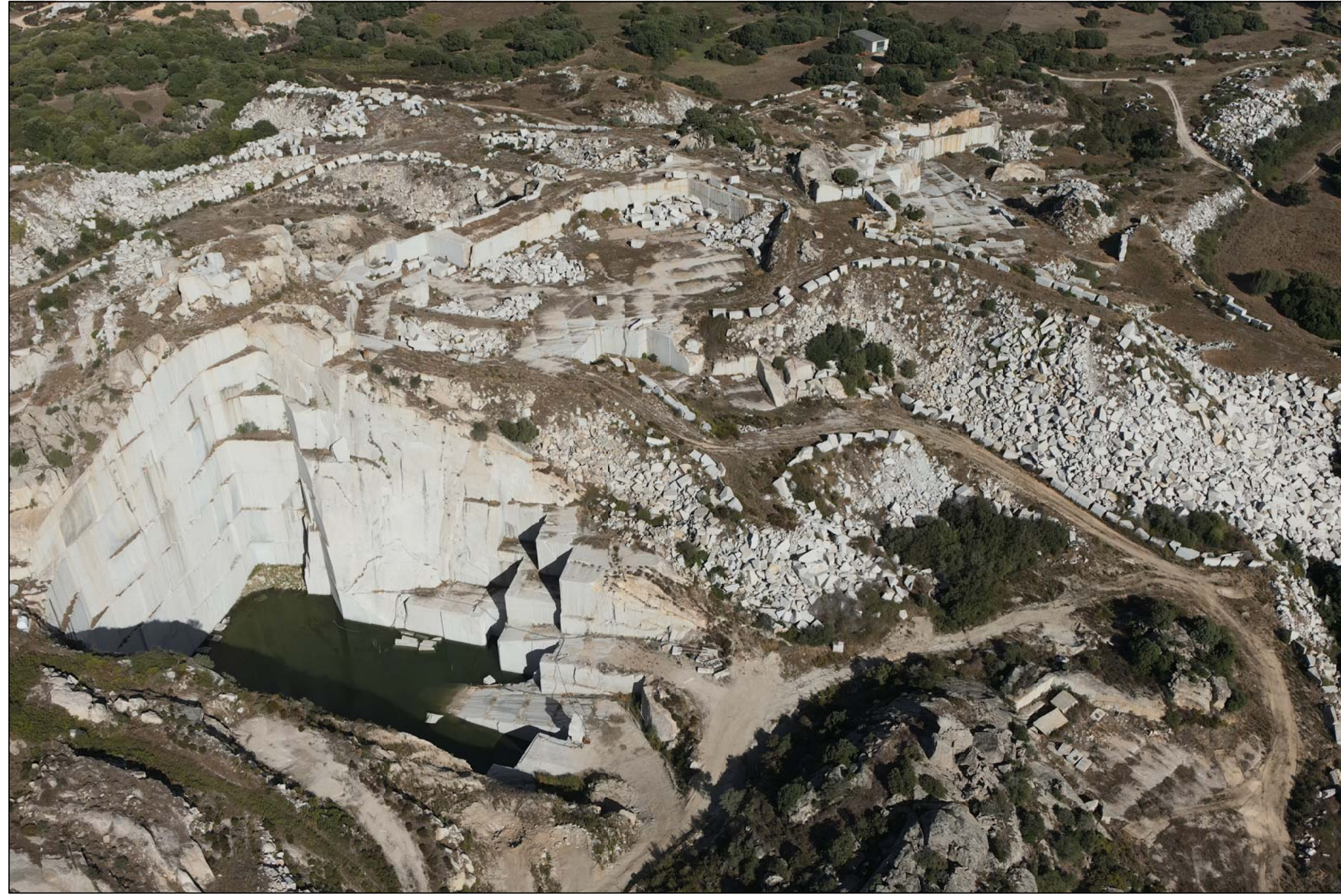
PUNTO DI VISTA 6